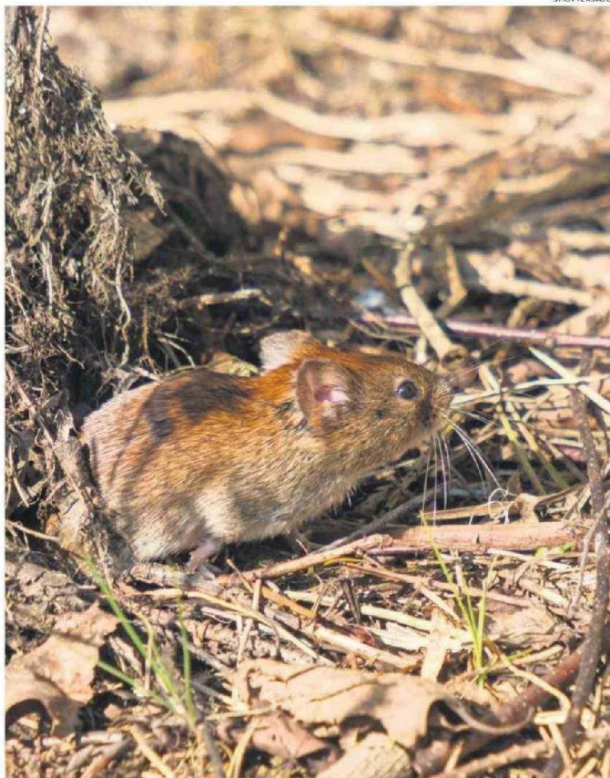
EL OLIGORYZOMYS LONGICAUDATUS ES EL ROEDOR PORTADOR DEL VIRUS ANDES.

Los nanoanticuerpos se consideran una versión simplificada de los anticuerpos convencionales y tienen la capacidad de neutralizar un