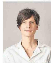
TISCHLER ES BIOTECNÓLOGA.

En esa línea, Tischler comenta que “nos enfocamos en generar un abanico de anticuerpos altamente específicos para el virus Andes, porque sabemos que