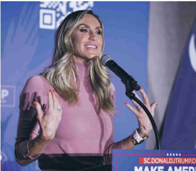
► La directora del Comité Nacional Republicano y nuera de Trump, Lara Trump.

tos Públicos e Internacionales de la Universidad de Princeton, dijo a La Tercera que ve en la familia Trump un intento por "crear una dinastía política".