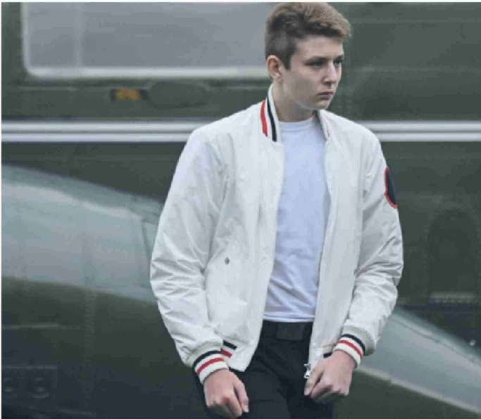
► El único hijo de Melania y Donald Trump, Barron Trump, de 18 años.