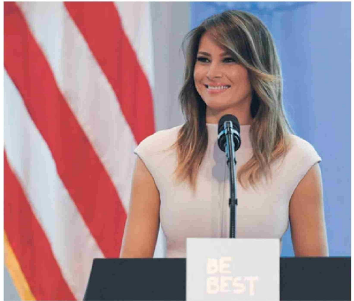
► Melania Trump, la tercera esposa de Donald Trump y exprimera dama de EE.UU.