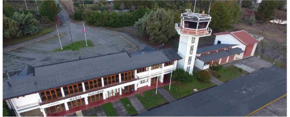
A FIN DE AÑO, la empresa JetSmart evaluaría realizar vuelos comerciales desde el aeródromo María Dolores.

El dirigente recaló que “(no hay que) olvidar que nuestra zona está más en el centro de lo que es la zona de más riesgo de incendio forestal. Entonces, contar con una buena pista, un buen aeropuerto y todas las instalaciones de seguridad, también nos permitiría, por ejemplo, que vengan aviones grandes para combatir el incendio forestal. Entonces, aquí hay una trilogía importante, pasajeros, el