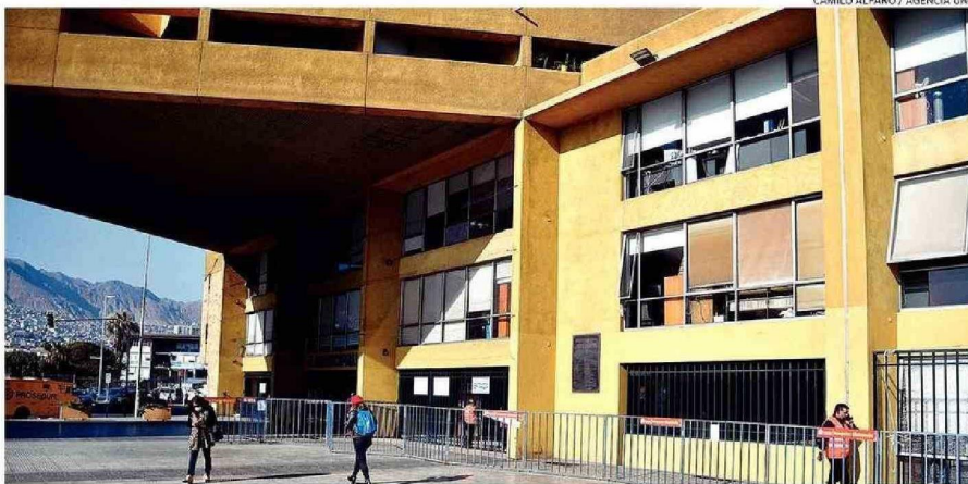
LA MUNICIPALIDAD DE ANTOFAGASTA NO TIENE PROYECTOS CON RS DESDE POR LO MENOS 2021.

Mientras, el consejero Gustavo Carrasco (Ind. - PPD) señala que hay pocos proyectos “grandes” presentados por las municipalidades. “El llamado siempre ha sido que los municipios presenten más proyectos y de gran envergadura. Y en eso están al debe los municipios de la región”.