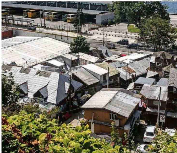
QUE SE ORDENE LA CIUDAD ES UNO DE LOS ASPECTOS PRIMORDIALES PLANTEADOS POR LOS ARQUITECTOS.

● Sobre motivar a privados para que desarrollen un proyecto en el ex Colegio San Javier, inmueble de Conservación Histórica desde 2009, se indicó que la idea del alcalde es que se puedan ejecutar en el interior, en sectores donde están los patios, por ejemplo, pero conservando la fachada del recinto, donde también funcionó hasta hace poco una sede de la Universidad de Los Lagos.