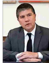
Subsecretario de Interior, Manuel Monsalve.

por videollamadas con sus familiares, e incluso con, eventualmente, integrantes de la organización criminal”. La autoridad apuntó a que desde el Ejecutivo “nos parece que esta decisión es completamente equivocada, que perjudica la seguridad del país, que socava los esfuerzos que hacen las instituciones para luchar contra el crimen organizado”. Además, hizo hincapié en que “el Ministerio de Justicia y Gendarmería van a usar todas las herramientas que dispone la ley para revertir medidas de esta naturaleza”. Diversos parlamentarios y dirigentes, desde Republicanos al PS, rechazaron también la medida.