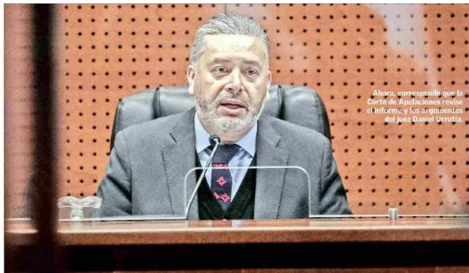
Ahora, corresponde que la Corte de Apelaciones revise el informe y los argumentos del juez Daniel Urrutia.

Las visitas donde se originó la controversia Todo se originó a partir de unas visitas a recintos penitenciarios efectuadas por Urrutia entre el 18 y 19 de enero pasado, en las que reos hablaron con el juez y escribieron sus solicitudes. De ellos, la mayoría pidió videollamadas con familiares (ver recuadro).