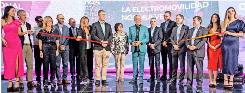
Este jueves, con la presencia de autoridades, representantes de empresas y de organizaciones, se inauguró al tercera versión de "Experiencia E", que estará abierta hasta hoy domingo en Espacio Riesco.