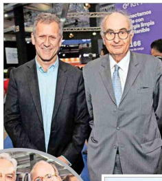
Juan Carlos Muñoz, ministro de Transporte y Telecomunicaciones, y Agustín Edwards, director de LUN.

Este jueves se realizó la apertura de la tercera edición del "Salón Internacional de la Movilidad Sostenible Experiencia E", y contó la presencia de autoridades y organizadores quienes enfatizaron cómo este encuentro se ha convertido en una iniciativa clave para el desarrollo y promoción de soluciones sostenibles en el ámbito de la movilidad en Chile y América Latina.