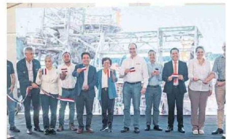
AUTORIDADES EN EL CORTE DE CINTA PROTOCOLAR.

En tanto, el gobernador regional Miguel Vargas, quien tam-