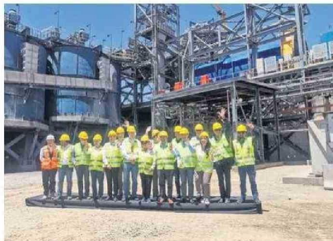
SE REALIZÓ UNA VISITA AL PROYECTO.