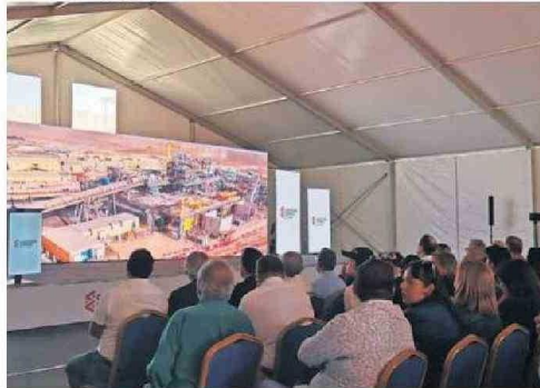
EVENTO SE DESARROLLÓ EN LA COMUNA DE CHAÑARAL.