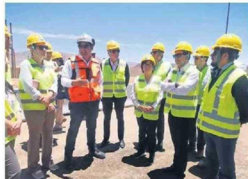
MINISTRA DE MINERÍA EN TERRENO JUNTO A OTRAS AUTORIDADES.

El gobernador destacó que el Proyecto de Desarrollo Mantoverde enfrentó una pandemia y otras dificultades vinculadas con las operaciones, por lo que el hecho de anunciar su continuidad operacional por 20 años más es una tranquilidad. “Muchas veces nos quedamos en el anuncio y lo que tenemos que hacer es transformar ese anuncio en un proyecto concreto que en el corto plazo inicie su etapa de construcción y pase con posterioridad a la etapa de operación y en esa tarea estamos trabajando con la ministra”.