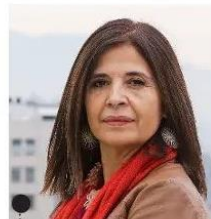
El bajo conocimiento de 32% de Marcela Ríos en Justicia la dejó como una ministra poco empoderada para proteger al Presidente del impacto de los conflictos por indultos y la Fiscalía Nacional.