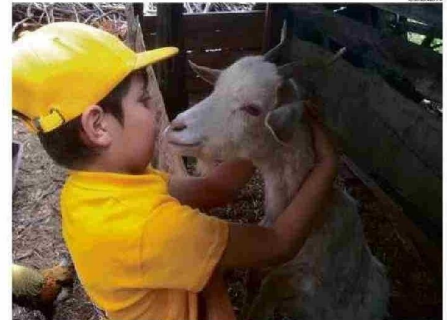
EN LA GRANJA EL RINCÓN DE ARTURITO HAY VARIEDAD DE ANIMALES.

Otro aspecto esencial para el éxito de estos emprendimientos es la difusión que se realiza en ferias asociadas al mundo rural, ubicadas en el corazón de las ciudades, como las plazas de Osorno, Puerto