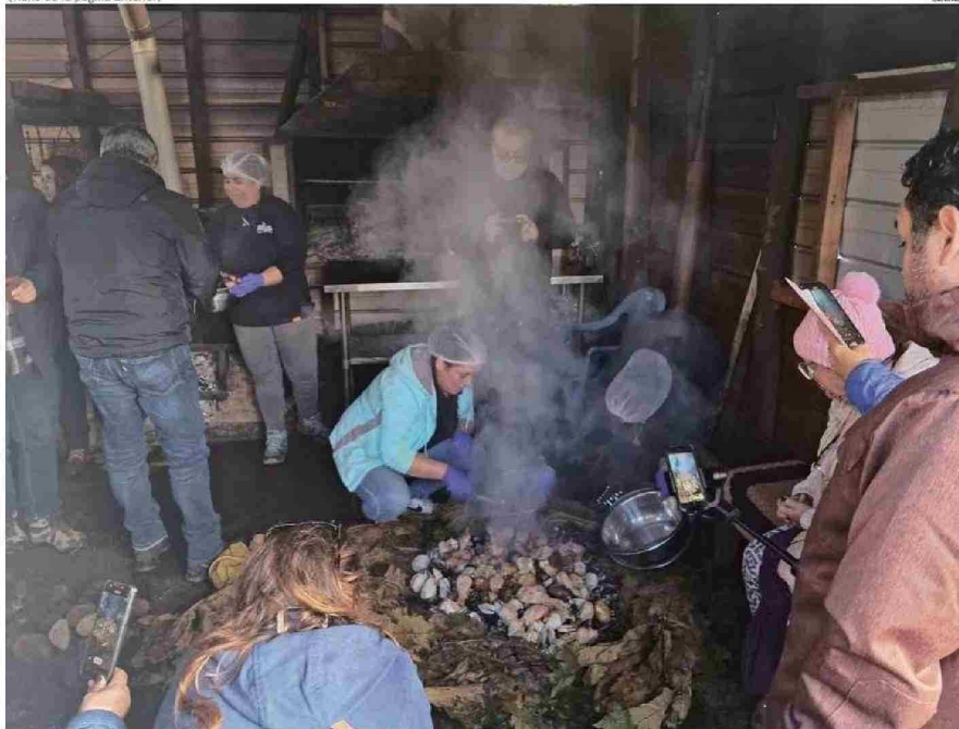
UNA DE LAS OPCIONES QUE OFRECE EL TURISMO RURAL ES DISFRUTAR DE COMIDAS TÍPICAS, COMO EL CURANTO AL HOYO.