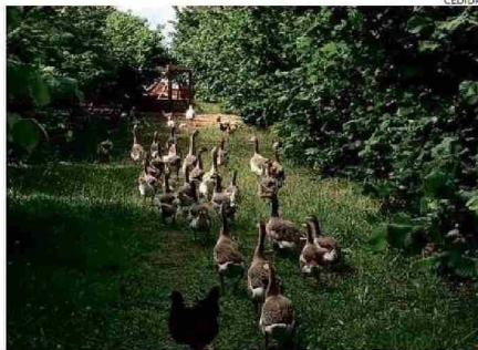
EN EL RINCÓN DE ARTURITO LAS AVES SON PARTE DE LA GRANJA.

"Todo lo que hemos construido aquí ha sido transportado en embarcaciones. Contamos con tinajas, espacios con duchas termosolares, un pequeño negocio de abarrotes, una zona de cabañas, arriendo de kayaks, paseos en lancha y, lo más importante, todo esto sin alterar la naturaleza viva de esta zona. Las personas que nos visitan buscan desconectarse de la agitada vida de las grandes urbes, y aquí encuentran esa paz. Este lugar es una bendición, algo que fue forjado principalmente por mis abuelos, especialmente mi abuela, quien falleció hace dos años a los 108 años. Su vida fue tan longeva porque era una mujer trabajadora, bondadosa y vivió rodeada de naturaleza toda su vida. Con su generosidad, qui-