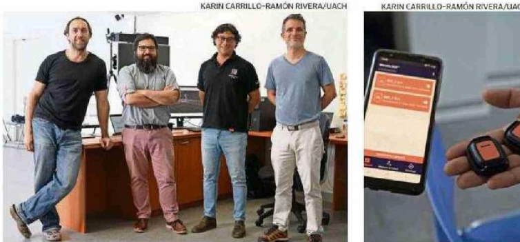
KARIN CARRILLO-RAMÓN RIVERA/UACH