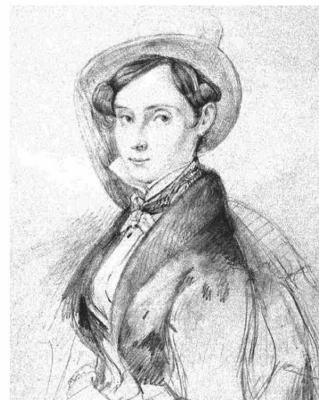
Boceto a lápiz de 1835, en el fondo Llancaño de Linares y cuyas casas se ven al fondo.

La chica, a su vez, no tiene dudas ni temores ni se inhibe por la pacata sociedad piducana. Así empieza un notable intercambio epistolar.