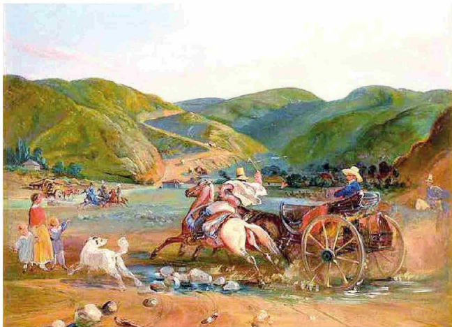
Calesa camino a la precordillera de Linares. Se observa el camino que sube, tal vez hacia Pejerrey.