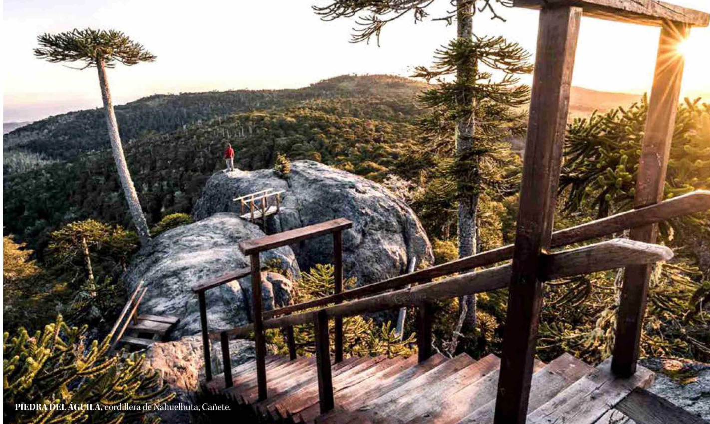
PIEDRA DEL ÁGUILA, cordillera de Nahuelbuta, Cañete.

Twitter @DiarioConce contacto@diarioconcepcion.cl