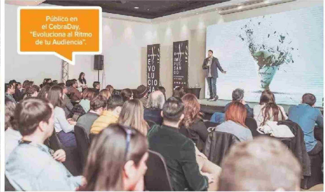
Público en el CebraDay, "Evoluciona al Ritmo de tu Audiencia".