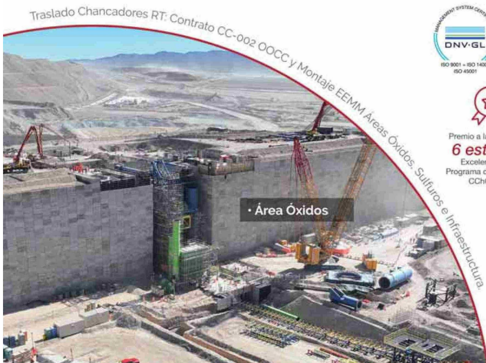
Traslado Chancadores RT: Contrato CC-002 00CC y Montaje EEMM Áreas Óxidos. Sulfuros e Infraestructura.

Integración con nuestros clientes en todos nuestros procesos y sistemas, para una ejecución de excelencia.