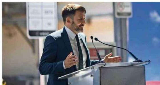
EL MINISTRO DE ENERGÍA, DIEGO PARDOW, INDICÓ QUE ESTE HITO DEMUESTRA QUE ENAP ESTÁ A LA VANGUARDIA EN INNOVACIÓN Y DESARROLLO TECNOLÓGICO EN EL CAMINO DE LA TRANSICIÓN ENERGÉTICA.