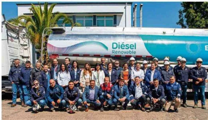
AUTORIDADES NACIONALES, REGIONALES Y EL EQUIPO ENAP DURANTE LA PRESENTACIÓN DEL DIÉSEL RENOVABLE ENAP, QUE REDUCE EN UN 80% LA HUELLA DE CO2 EQUIVALENTE POR CADA LITRO DE ACEITE USADO.