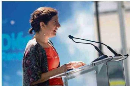
LA MINISTRA DE CIENCIA, TECNOLOGÍA, CONOCIMIENTO E INNOVACIÓN Y VOCERA (S) DE GOBIERNO, AISÉN ETCHEVERRY, DESTACÓ EL IMPACTO EN EL CUIDADO DEL MEDIOAMBIENTE.