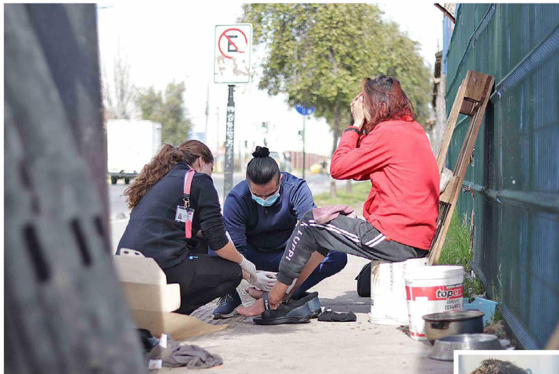
Las personas en situación de calle reciben atención médica durante el periodo de invierno.

La Seremi de Desarrollo Social y Familia en conjunto con el Servicio de Salud O'Higgins, prestarán los servicios orientados a proteger la vida y salud a las personas, producto de las condiciones climáticas durante el invierno.