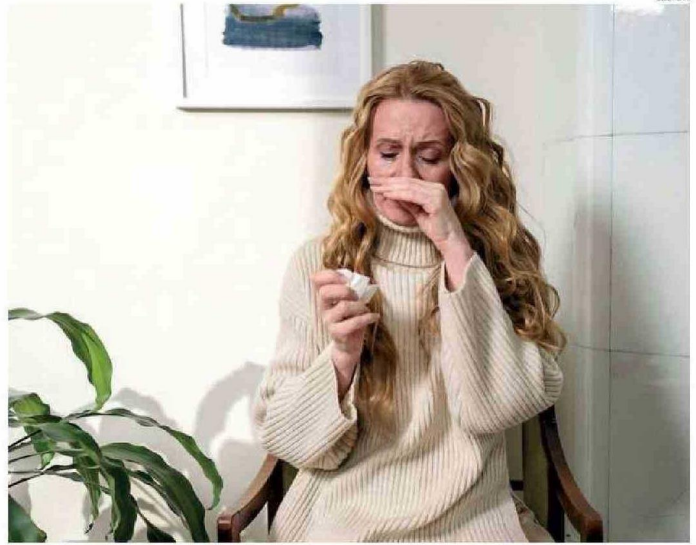
HOY EN DÍA EL COMERCIO MANEJA UNA SERIE DE SUELOS QUE PUEDAN AYUDAR EN ESTAS PATOLOGÍAS.

Mantener el hogar limpio y libre de polvo: En especial en zonas urbanas, donde la exposición a alérgenos co-