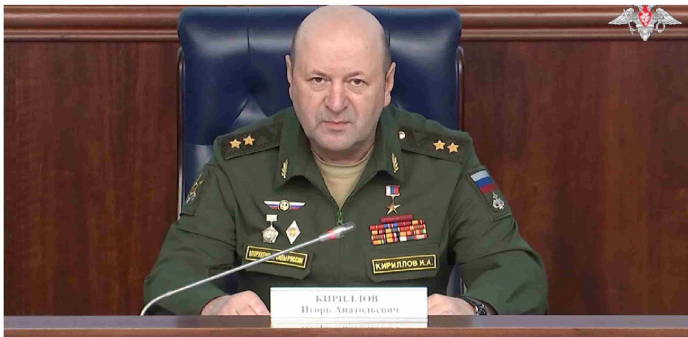
► El teniente general Igor Kirillov, jefe de las Tropas de Protección Nuclear, Biológica y Química de Rusia, asiste a una conferencia de prensa en Moscú, Rusia, el 5 de noviembre.