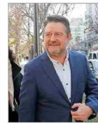
Gobierno regional suscribió contrato con fundación investigada.

REFORMA AL SISTEMA DE NOMBRAMIENTOS INGRESA HOY: MINISTERIO DE JUSTICIA PROpondrá CONSEJO PERMANENTE DE CINCO MIEMBROS Y MANTENER LOS CUPOS DE SUPREMOS "EXTERNOS" | C 2