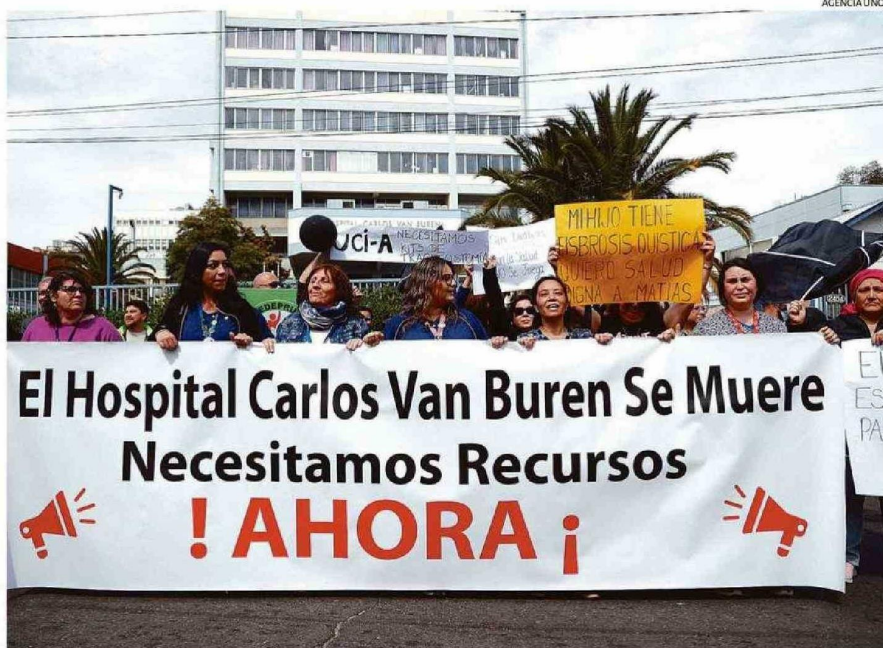
TRABAJADORES DEL ÁREA DE LA SALUD EMPLAZARON AL GOBIERNO. ASEGURAN QUE SE NECESITAN RESPUESTAS A NIVEL CENTRAL.

En medio de este revuelo, la consigna de los funcionarios de la salud ha sido que el panorama es aún más catastrófico que el del año 2019, ocasión en la que el recinto porteño vi-