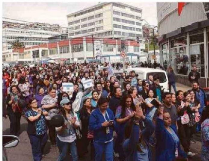
POR UNOS MINUTOS, FUNCIONARIOS SALIERON A LAS CALLES.

Con un diagnóstico claro, ofuscados en buscar res-