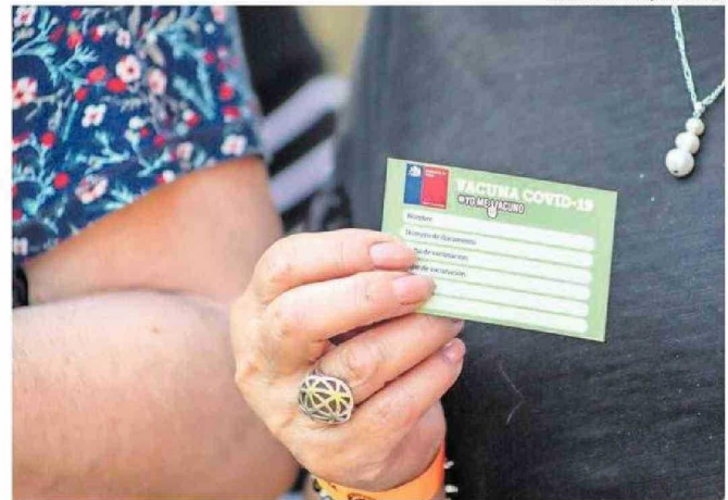
DESDE OCTUBRE DE 2023, LA OMS RECOMIENDA YA SÓLO UNA DOSIS ANUAL.

Tedros subrayó no obstante que la evaluación de la enfermedad por los ex-