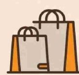
CONSUMO DE HOGARES POR REGIÓN VAR. ANUAL