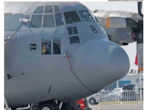
UN AVIÓN HÉRCULES C-130 COMO EL SINIESTRADO.