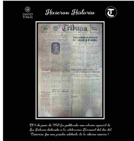
El 6 de junio de 1958 fue publicada una edición especial de La Tribuna dedicada a la celebración Nacional del día del Comercio, fue una prueba adelantada de la edición número 1.

El año 2018, cuando el Diario La Tribuna cumplió seis décadas de existencia, se publicó una edición ani-