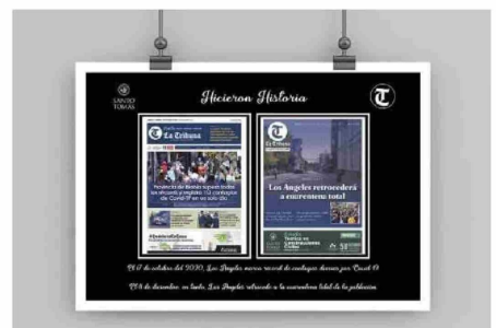
El 18 de agosto de 2018 se publicó una edición especial de La Tribuna dedicada a la tragedia del 50 de mayo.