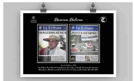
El 18 de agosto de 1962 se publicó una edición especial de La Tribuna dedicada a la tragedia del Regimiento de Carabineros, que permitió al lector en cada una de las páginas del deporte.