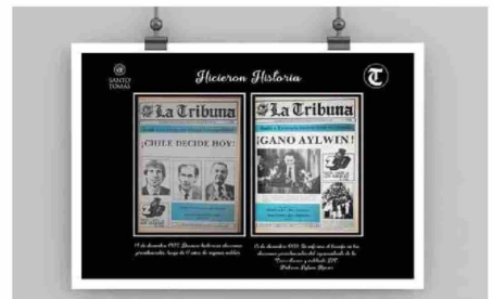
El 16 de agosto de 1961 se publicó una edición especial de La Tribuna dedicada al triunfo de Chile, que permitió al lector en cada una de las páginas del deporte.