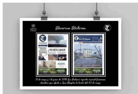
El 18 de agosto y 1 de junio de 2009 La Tribuna repitió varias ediciones especiales que reflejaron la tragedia del 50 de mayo.