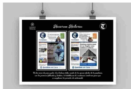
En la época de la pandemia de COVID-19, La Tribuna publicó varias ediciones especiales que reflejaron la tragedia del 50 de mayo.