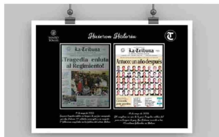
El 18 de agosto de 1962 se publicó una edición especial de La Tribuna dedicada a la tragedia del Regimiento de Carabineros, que permitió al lector en cada una de las páginas del deporte.