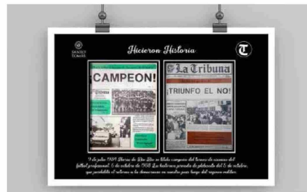
El primer 1961 durante el Mundial de Fútbol se publicó una edición especial de La Tribuna dedicada al triunfo de Chile, que permitió al lector en cada una de las páginas del deporte.

de inundaciones e incendios forestales que han afectado fuertemente en nuestra zona.