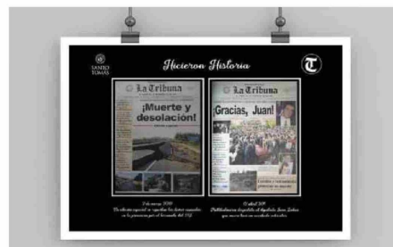
El 18 de agosto de 1962 se publicó una edición especial de La Tribuna dedicada a la tragedia del Regimiento de Carabineros, que permitió al lector en cada una de las páginas del deporte.