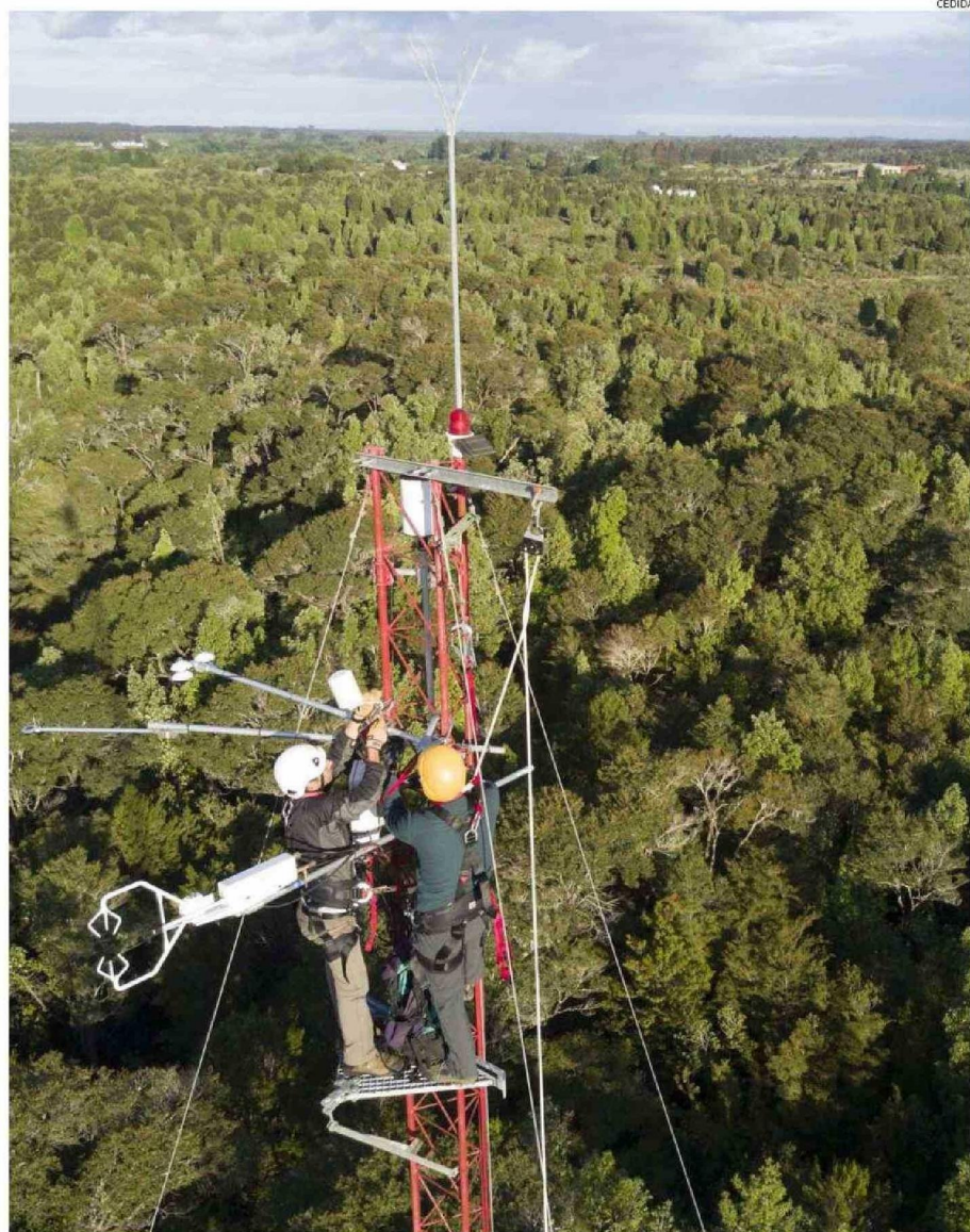
EL INVESTIGADOR SEÑALÓ QUE EL ESTUDIO DESMIENTE LA TEORÍA QUE LOS BOSQUES ANTIGUOS YA NO ACUMULABAN CARBONO.