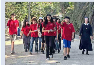
Parte del grupo de estudiantes misionando en Pomaire.