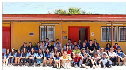
Alumnos del Colegio San Miguel Arcángel en la escuela de Guayacán, Cabildo.