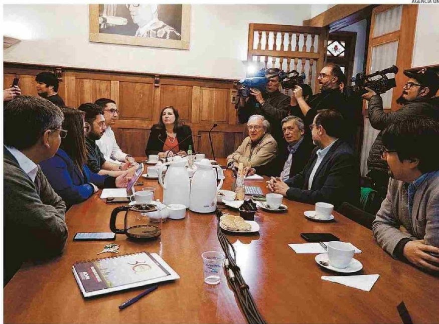
SEPTIEMBRE DE 2023: PARTIDOS DE GOBIERNO ADOPTAN ACUERDOS CON MIRAS A 2024. HOY TAMBIÉN EL PRESIDENTE LES PIDE UNIDAD.

También, expone, el fin del ciclo de los comicios locales y regionales parece indicar la detención del péndulo ideológico que caracterizó a las elecciones desde el primer proceso constituyente, puesto que "la distribución de votos muestra claramente que las opciones de centro derecha y centro izquierda están teniendo una mayor ad-