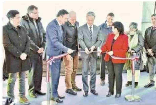
Con la presencia de las máximas autoridades regionales, Aguas Magallanes dio a conocer los adelantos de su planta de tratamiento de aguas servidas de Puerto Natales.

La implementación de un avanzado sistema de tratamiento biológico no sólo optimizará la cali-