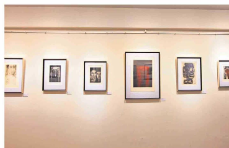
Tanto en su labor docente, así como por su trabajo, Cruz ha sido una fuerte influencia para muchos grabadores y grabadoras.