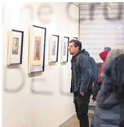
Todas las obras de la muestra son de los inicios del artista en los años 60.

La muestra "Memoria del mutante" reúne diversas obras del célebre grabador penquista y también festeja los 15 años de la galería.