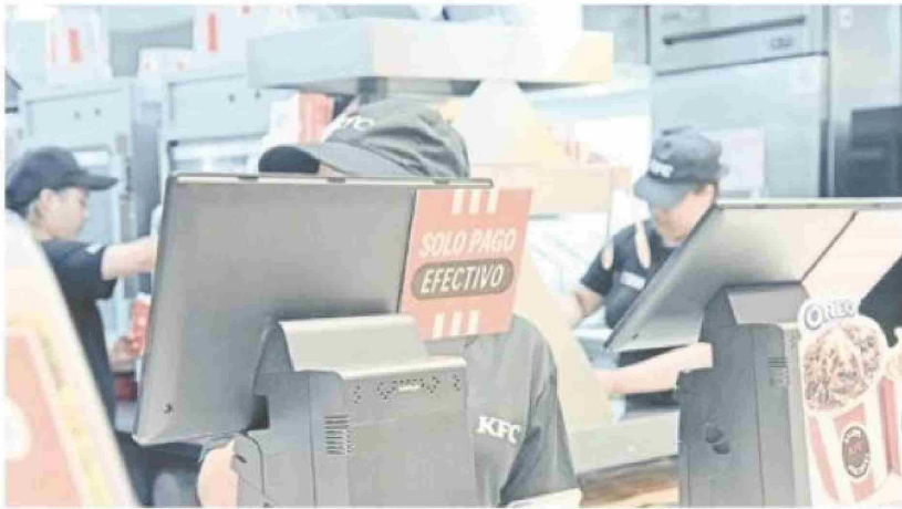
Sólo pago en efectivo aceptaban en KFC.

Hubo un corte en la Fibra Óptica Austral