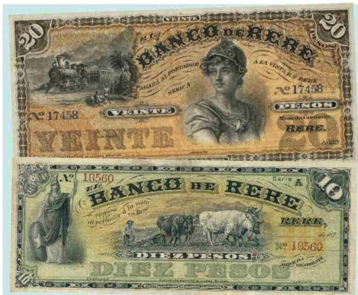
LOS REGISTROS corresponden a los billetes que emitió el Banco de Rere, a fines del siglo XIX.