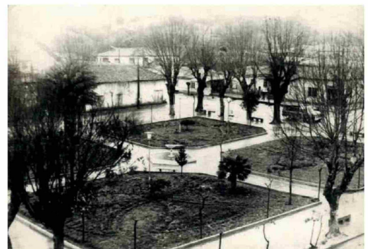
Plaza de Armas de Rere a mediados de 1960.