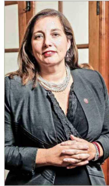
La senadora Paulina Vodanovic (PS) buscará la reelección.