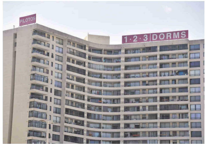
Más de cien mil viviendas había en venta a fines del año pasado en el país.

El beneficio no sería aplicable a compraventas de promesas celebradas con anterioridad al 31 de diciembre de 2024 ni a créditos renovados. El proyecto de ley -resulta-