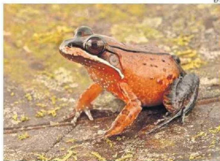
UNA RANA (LEPTODACTYLUS RHODOMYSTAX) EN EL BOSQUE PERUANO.