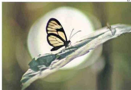
UNA OLERIA SP. HUBO 10 MARIPOSAS NUEVAS DESCUBIERTAS.