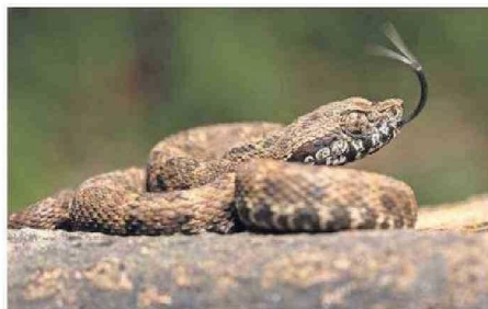
SERPIENTE (BOTHROPUS ATROX) FOTOGRAFIADA POR LA EXPEDICIÓN.