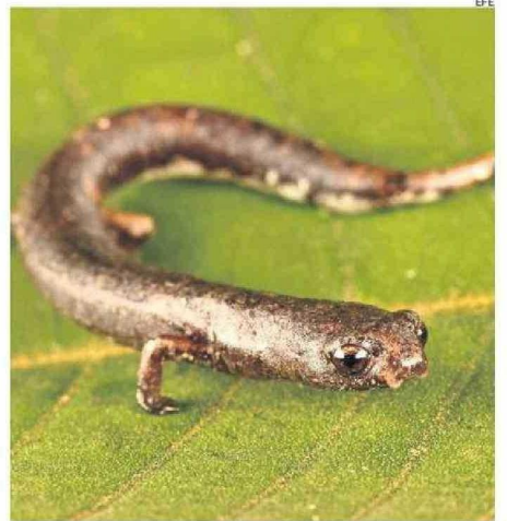
SALAMANDRA (BOLITOGLOSSA SP.) CAPTADA DURANTE LA EXPEDICIÓN.