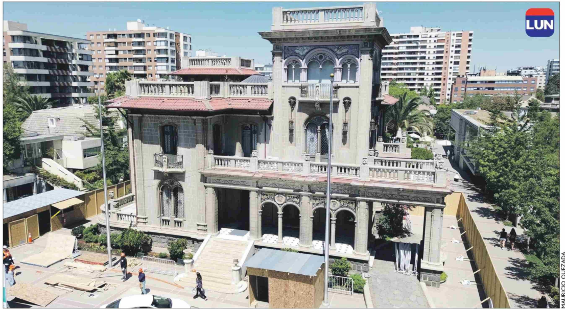
Por ahora no se tocarán los delicados azulejos de la fachada.

También recibirán atención todos los balaustres del edificio, esos pequeños pilares de cemento que sostienen las pesadas barandas de los balcones y terrazas, muchos de los que han perdido sus detalles originales. "Afortunadamente encontramos unos cuantos en muy buen estado, que servirán como modelos a reproducir con el uso de un torno para mezcla de cemento, tal como se hacía artesanalmente a principios del siglo XX", explica la magíster en Arquitectura Sustentable.