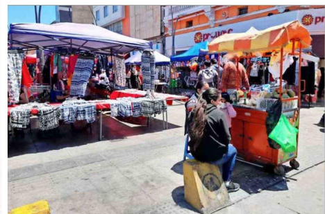
En el comercio (-5,8%) y en otras actividades de servicio (-12,9%) es donde mayormente disminuyó la informalidad el último trimestre de 2024.

CARMEN CIFUENTES, INVESTIGADORA CLAPES UC