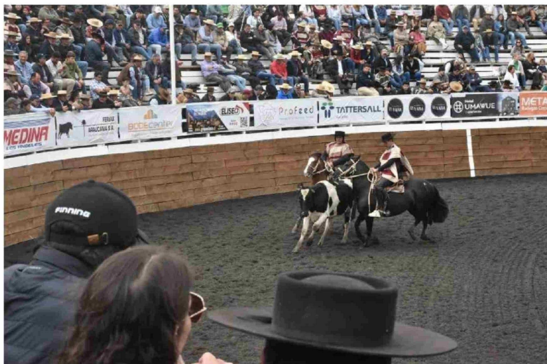
LA MEDIALUNA DEL RECINTO SOCABIO es el escenario donde se disputa hasta este domingo el Clasificatorio Zona Sur de Rodeo.

Las dos primeras jornadas del Clasificatorio de Rodeo Zona Sur, Los Angeles 2025, que se realiza en la Medialuna del Recinto Socabio, han destacado por la buena organización y una masiva presencia de público.