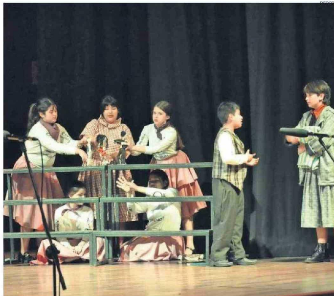
ESTUDIANTES DE 7° Y 8° BÁSICO REALIZARON LA OBRA DE GABRIELA MISTRAL.

“Se establece una obligación del Estado, desde la institucionalidad pública y privada, para prevenir, sancionar y erradicar la violencia contra mujeres. Actualmente con la ley integral se amplía el espectro de distintos tipos de