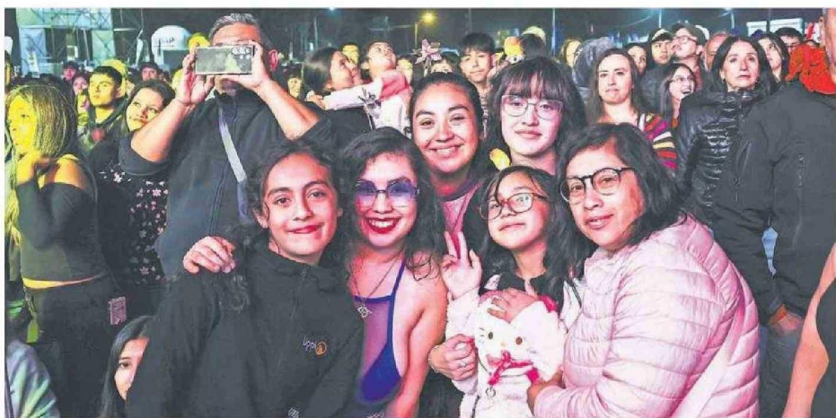
MUCHAS FAMILIAS DE TODA LA REGIÓN DEL BIOBÍO Y DE OTRAS ZONAS DEL PAÍS PRESENCIAN LOS SHOWS MUSICALES DE FAGAF 2025.