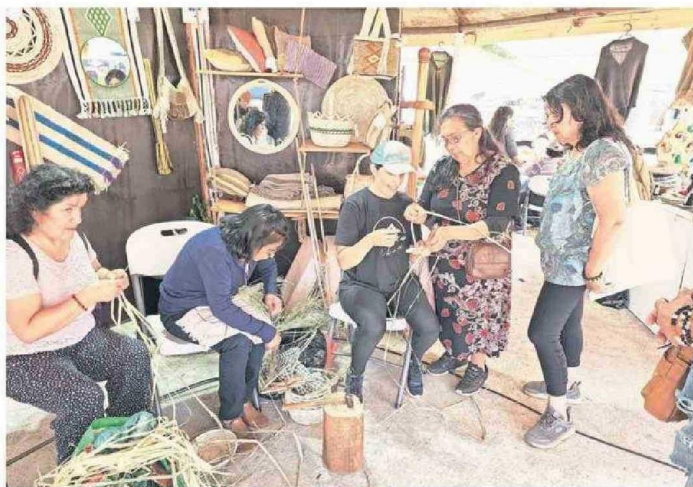
TALLERES QUE DAN A CONOCER EL TRABAJO DE LOS ARTESANOS SE HAN PODIDO REALIZAR EN FAGAF.

La Municipalidad de Cañete organiza la Feria Agrícola Ganadera y Forestal (Fagaf 2025), que se desarrolla entre el 29 de enero al 2 de febrero, como una forma de dar a conocer las actividades típicas y costumbres del mundo campesino local a través de la demostración y venta de los productos agropecuarios, artesanales y forestales.