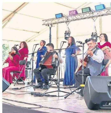
PRESENTACIONES DE MÚSICA FOLCLÓRICA SIEMPRE PRESENTES.