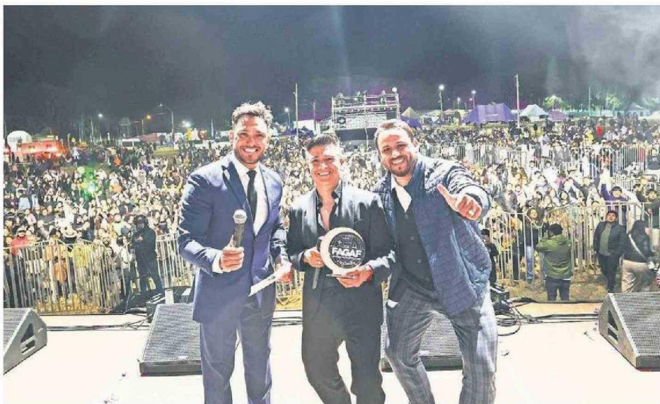
EL CANTANTE NACIONAL AMÉRICO SE PRESENTÓ ANTE UN MASIVO PÚBLICO EN LA EXPLANADA DE LA FERIA. EL PÚBLICO LO ACLAMÓ.