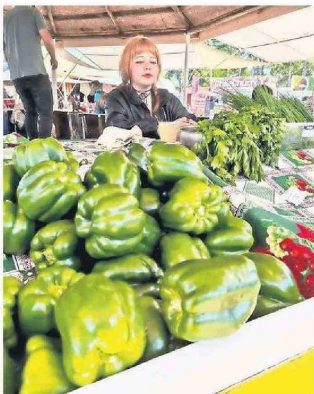
PRODUCTOS AGRICOLAS ESTÁN EN VENTA PARA LOS TURISTAS.