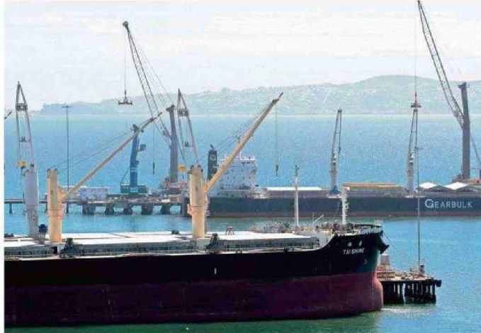
DESDE LOS PUERTOS DEL BIOBÍO SE EMBARCAN MUCHOS PRODUCTOS DE LA REGIÓN DE ÑUBLE.

Sostuvo que “nuestra Región del Biobío, en particular, se caracteriza por las actividades económicas del ámbito forestal, pesca, servicios, energía y también por ser una región portuaria. Por lo anterior, es que la constante mantención y modernización de los puntos de entrada y salida de nuestras ciudades -aeropuertos, carreteras y puertos- se vuelve fundamental por