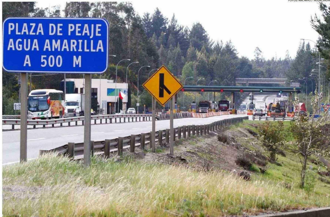
LA RUTA DEL ITATA ES LA PRINCIPAL VÍA DE COMUNICACIÓN ENTRE LAS REGIONES DE ÑUBLE Y BIOBÍO. SU BUEN ESTADO ES CLAVE PARA EL TRASLADO DE PRODUCTOS.

Recientemente se anunció la licitación de estudios para el tren Concepción-Chillán-Santiago y se tomó a aquello como un buen ejemplo de la relevancia de conectar dos ciudades clave para el país.