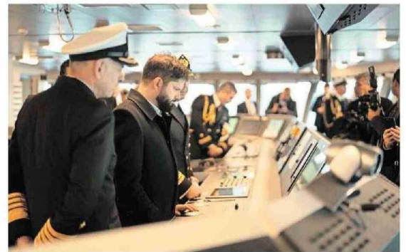
Posterior a la ceremonia, el Jefe de Estado recorrió parte de sus dependencias.