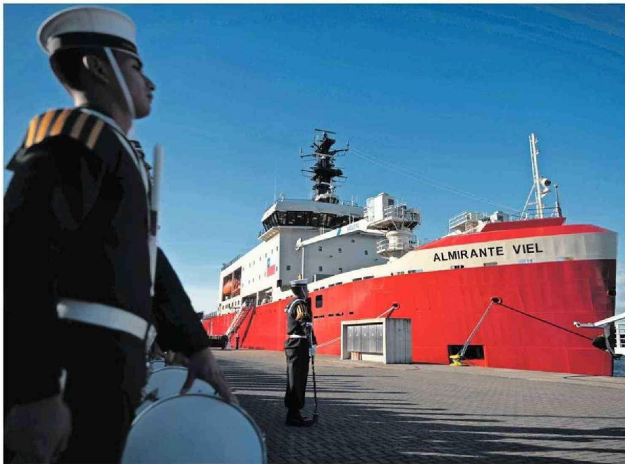
La embarcación es la primera de este tipo que se construye de forma íntegra en Sudamérica.

Luego de su entrega por parte de Asmar, el rompehielos Viel se trasladará en agosto a Valparaíso para el proceso de inducción y en enero viajará al extremo sur.