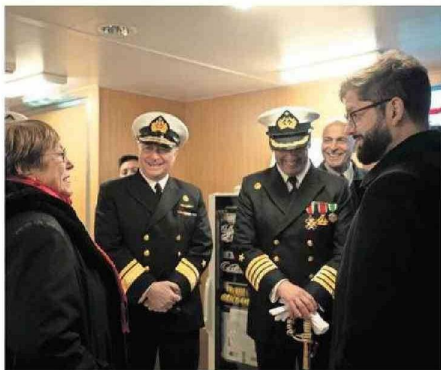
En la ceremonia participó la expresidenta Michelle Bachelet.

En esa línea, planteó que "es nuestra obligación como Estado contar con planes de largo aliento porque los desafíos del Siglo XXI nos obligan a ser previsores, las crisis climáticas, los cambiantes escenarios económicos y la geopolítica global nos exigen una vigilancia y un sentido de responsabilidad que no es sólo nacional porque proteger la Antártica es también proteger el futuro de la vida en nuestro planeta".