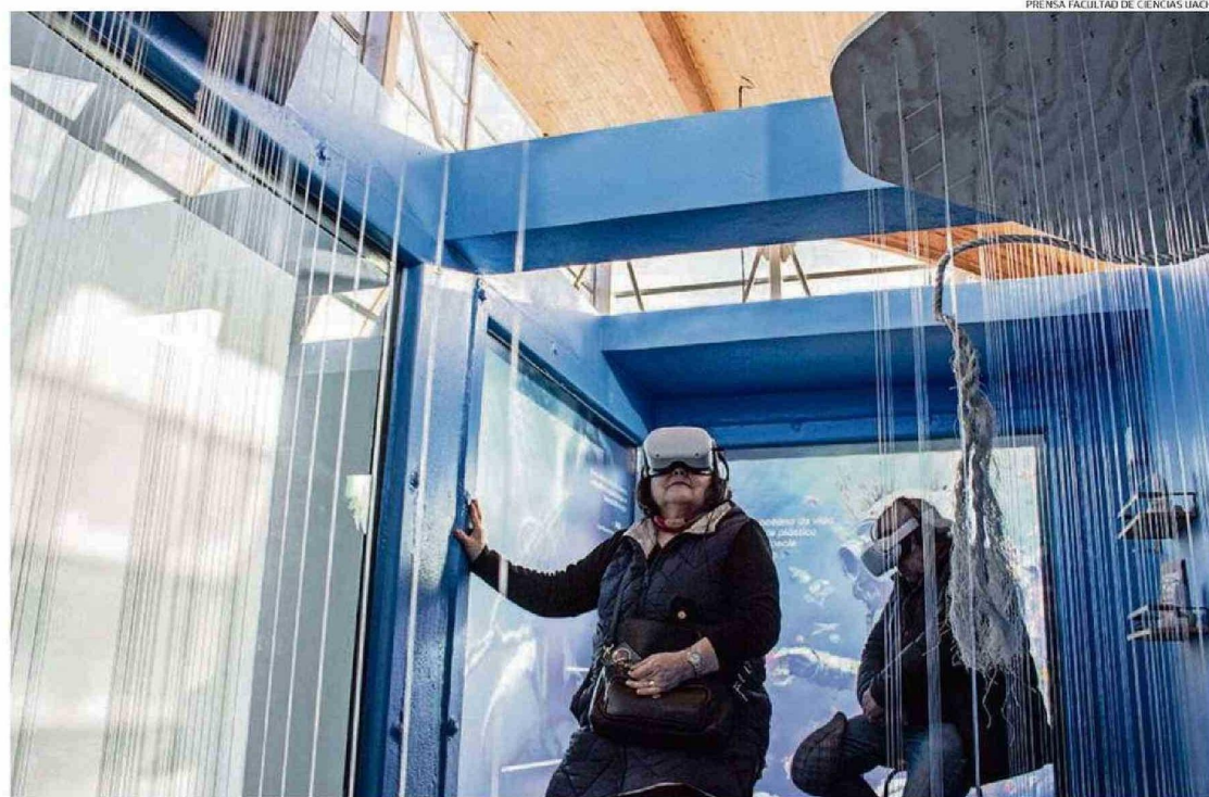
UNO DE LOS PRINCIPALES ATRACTIVOS ES LA EXPERIENCIA DE BUCEO GRACIAS AL USO DE GAFAS DE REALIDAD VIRTUAL.

El laboratorio depende de la Facultad de Ciencias de la Universidad Austral de Chile. Está ubicado a 30 kilómetros de Valdivia, camino a Curianco y fue inaugurado el 3