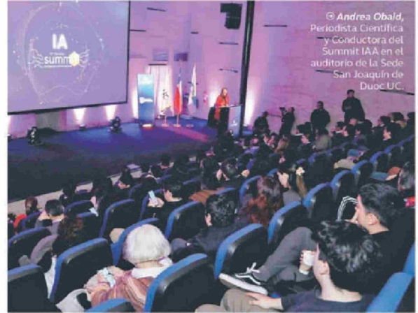
© Andrés Obald , Periodista Científica y conductora del Summit IAA en el auditorio de la Sede San Joaquín de Duoc UC.