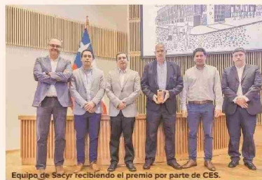
Equipo de Sacyr recibiendo el premio por parte de CES.