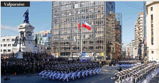
El Presidente Boric retorna a la Plaza Sotomayor. El acto contó con la presencia del jefe de Estado, quien el año pasado concurrió a la ceremonia en Iquique. El mandatario se arrodilló y dejó una rosa blanca frente a los restos de Arturo Prat.

Incorporará un rompehielos, un patrullero y un remolcador: La Armada alista tres nuevas naves para potenciar el desarrollo del territorio antártico chileno