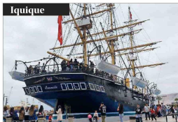
En familia, cientos de personas visitaron la representación a escala de la corbeta "Esmeralda", que alberga un museo.