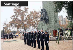
Personal de la Armada y reservistas desfilaron y rindieron honores a los héroes de Iquique y Punta Grieta.