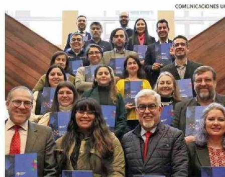
EL LANZAMIENTO SE REALIZÓ EN EL CAMPUS MENCHACA LIRA DE UCT.