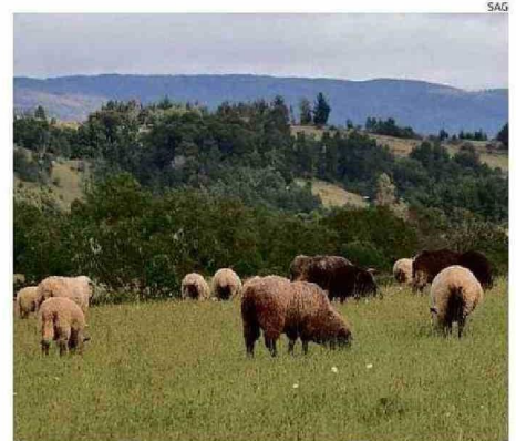
LOS ANIMALES DE GRANJA DEBEN SER DECLARADOS EN ESTE REGISTRO.