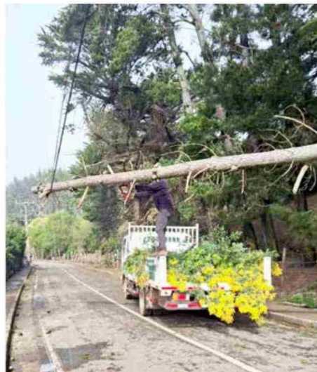
El Municipio ha trabajado para retirar los árboles caídos.

estaban bajo refrigeración, otro factor que se suma a la falta de electricidad es que, en tal comuna, en muchos casos dicho escenario también deriva en la ausencia de agua. “Muchos vecinos cuentan con pozos profundos, con norias que necesitan de electricidad para tener agua”, dijo. “Espero que la empresa CGE se ponga las pilas (...) Así como ustedes como empresa exigen a todos sus clientes, a todos nuestros vecinos, tanto de Vichuquén como de nuestro país, nosotros también les exigimos que por favor nos den un abastecimiento de calidad y que puedan reponer cuanto antes, estos servicios básicos para toda nuestra gente”, cerró Rivera.