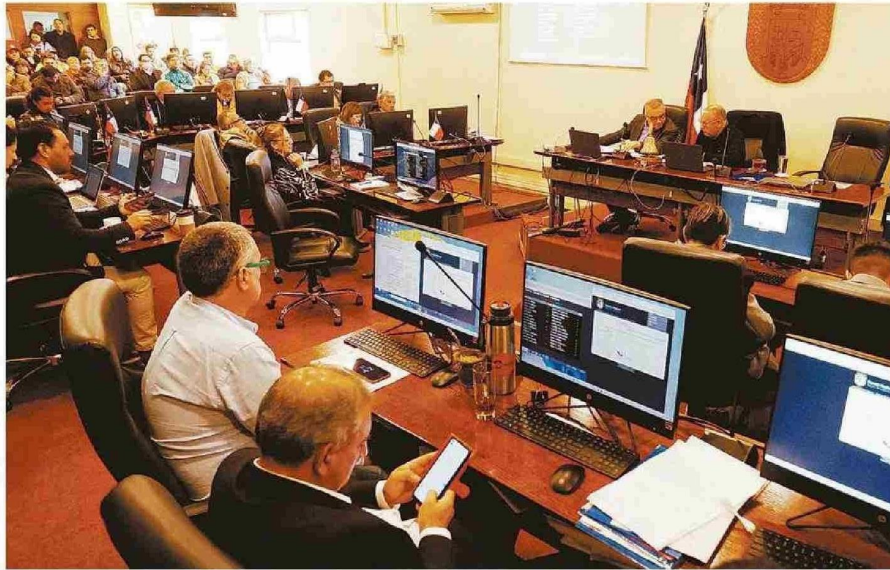
DE LOS 28 ESCAÑOS DEL CORE, SÓLO 13 PERSONAS VAN A LA REELECCIÓN, LO QUE ABRE EL APETITO A TODOS LOS PARTIDOS.

Aun así, expresa que "somos muy optimistas en cuanto a los resultados que obtendremos en las elecciones venideras. Es un hecho que vamos a crecer y que Republicano llegó para quedarse, pero como digo, la gestión que ya hacen nuestros candidatos, el respeto con que se les ve actuar en las calles, la dedicación y atención hacia quienes quieren saber más, entregan un beneficio partidista por transitoriedad".